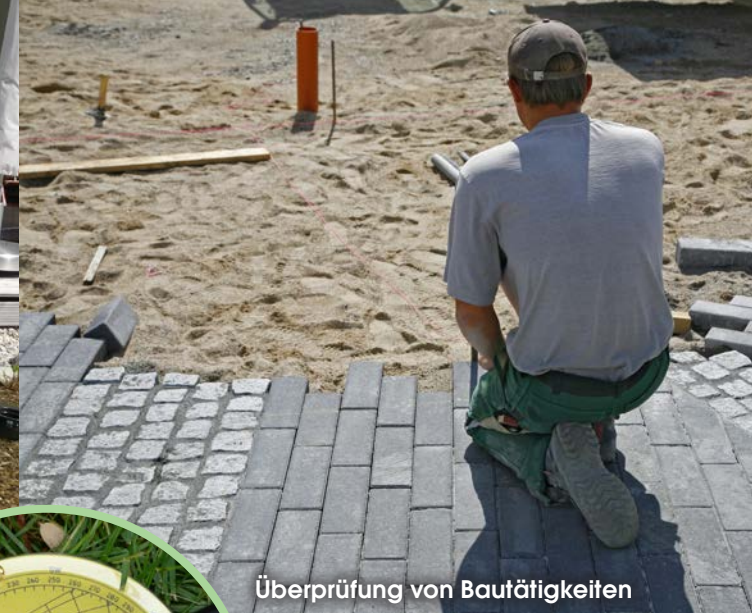
Überprüfung von Bautätigkeiten