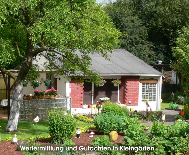
Wertermittlung und Gutachten in Kleingärten